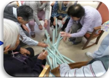
崩れちゃいます・・・