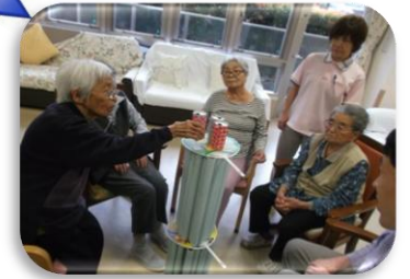
さらに3段目に缶を！