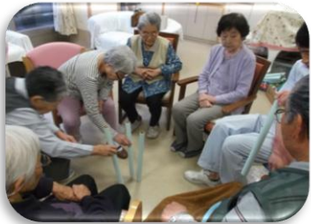
まず、中心に棒を立てます！