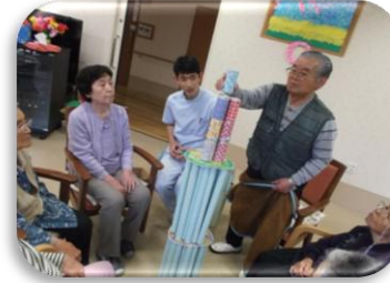
すご～く集中してます